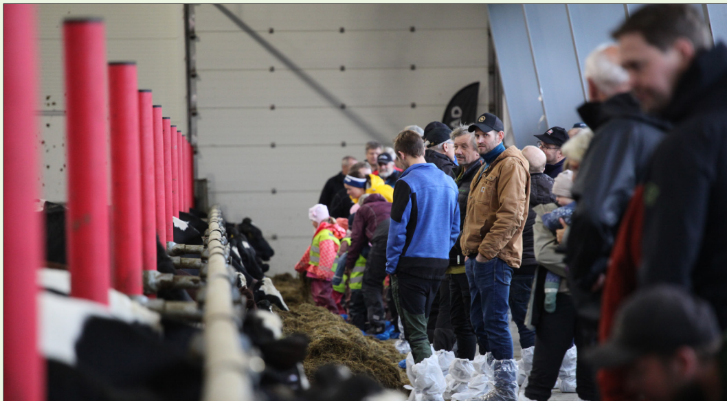
Åpen dag ble arrangert i samarbeid med Fjøssystemer og imponerende 250 personer kom for å se på nyfføset.